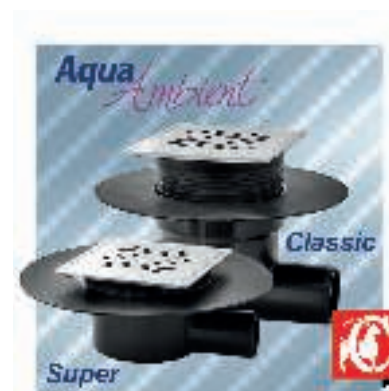
CAPRICORN, Łazienkowe wpusty punktowe Aqua Ambient. Typ: dostępne w wersji Classic (przepływ 48 l/min) – uniwersalne do każdego typu pomieszczeń; dedykowane do średnicy rur Ø50 oraz Super (przepływ 21 l/min) – zaprojektowanej specjalnie dla pomieszczeń z ograniczeniami w wysokości posadzki; dedykowane do średnicy rur Ø50 lub Ø40. Materiał: korpus: Polipropylen, kratka: stal nierdzewna.