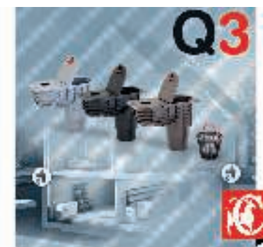
CAPRICORN, Kanalizacja zewnętrzna - odprowadzanie wody deszczowej. Asortyment: zewnętrzne odwodnienia liniowe, zasuw burzowe (jedno- i dwuklapowe), osadniki rynnowe.