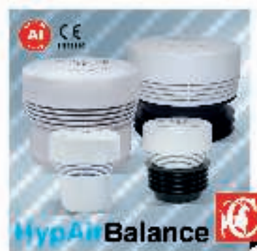
CAPRICORN, Zasuwy napowietrzające HypAir Balance. Typ: MaxiHab \varnothing 110 , \varnothing 70 - \varnothing 110 , Przepływ 26 l/s oraz MiniHab \varnothing 50 , \varnothing 32 - \varnothing 63 , Przepływ 7 l/s. Cechy szczególne: zgodne z normą EN 12380, posiadają najwyższą klasę AI dopuszczającą ich instalację poniżej poziomu zalewania oraz umożliwiającą działanie w temperaturze w zakresie od -20 do +60^{\circ}\text{C} . Materiał: ABS.