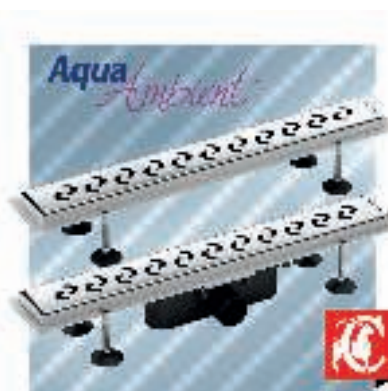
CAPRICORN, Łazienkowe wpusty liniowe Aqua Ambient. Typ: dostępne w wersji z syfonem (przepływ 48 l/min.) oraz w wersji dostosowanej pod syfony brodzikowe Ø52. Wykonane według najwyższych standardów, wykończone eleganckim rusztem ze stali nierdzewnej lub kamieniem naturalnym. Materiał: korpus i ruszt – stal nierdzewna, syfon – Polipropylen, ABS.

Wersja Classic: typy podejścia – boczny / boczny z kołnierzem oraz prosty / prosty z kołnierzem; dedykowane do rur o średnicy Ø50.